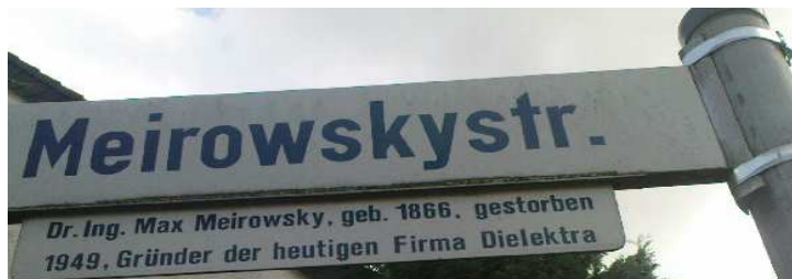
Foto: Erläuternder Text zum Straßenschild