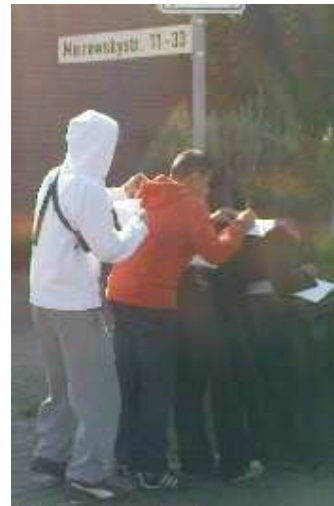
Fotos: Besichtigung der Meirowskystraße und Anfertigung von Notizen vor Ort